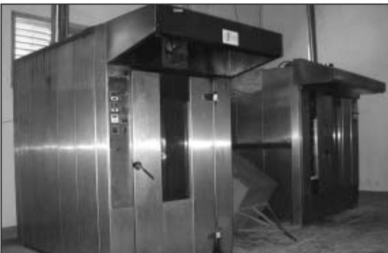
Backöfen in der Solarbäckerei in Ouagadougou

Diese Investition rechnet sich aber in einem überschaubaren Zeitraum: Denn infolge der Wirtschaftskrise in Argentinien sind die Energiepreise gestiegen, eine 20-Kilogramm-Flasche Gas kostet mittlerweile 20 Pesos. Auch sind die Indios durch das Kochen mit dem Gas einen anderen Standard gewöhnt, da sie nicht mehr jeden Tag die immer spärlicher werdenden Zweige der Tola-Sträucher als Brennstoff einsammeln wollen.