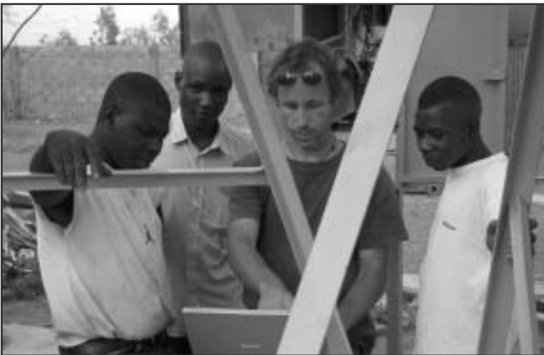
Kontrollstation der Solarbäckerei in Ouagadougou