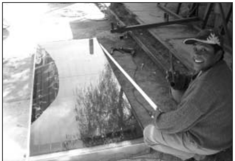
Warmwasserkollektoren gebaut von der Kooperative PIRCA/Tilcara in Argentinien